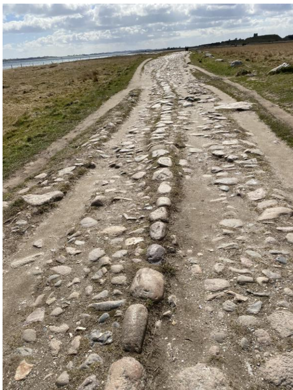
Middelaldervejen til Kalø