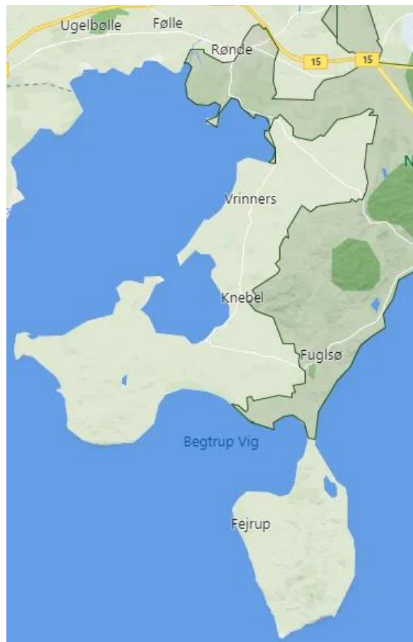
Kortudsnit fra vores køretur